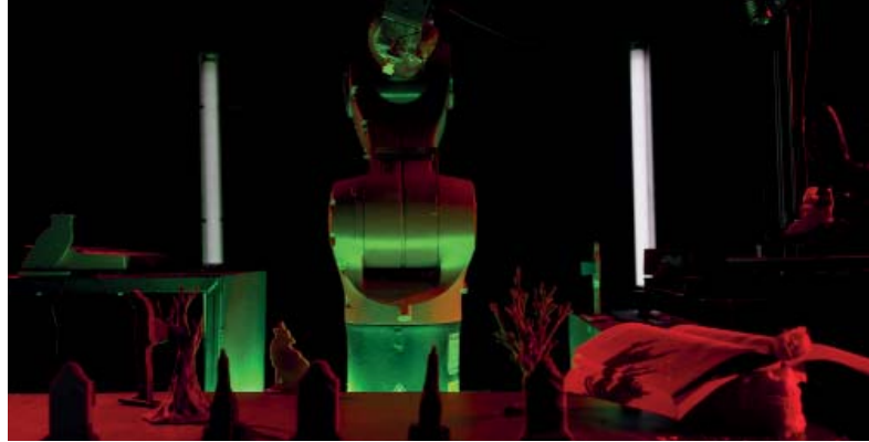
Artefact © Nicolas Boudier

LE THÉÂTRE AUGMENTÉ, POUR QUELS EFFETS SUR LA RÉCEPTION DU PUBLIC ?