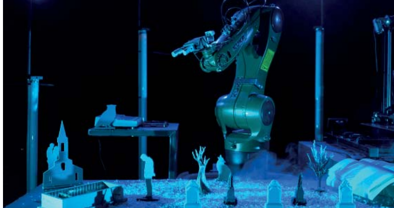
Artefact © Nicolas Boudier

LE THÉÂTRE AUGMENTÉ, POUR QUELS EFFETS SUR LA RÉCEPTION DU PUBLIC ?